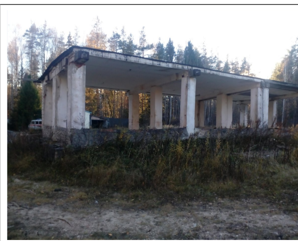
Вид склада материальных запасов