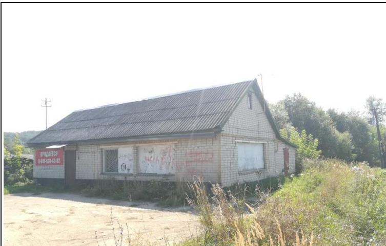
Вход в магазин