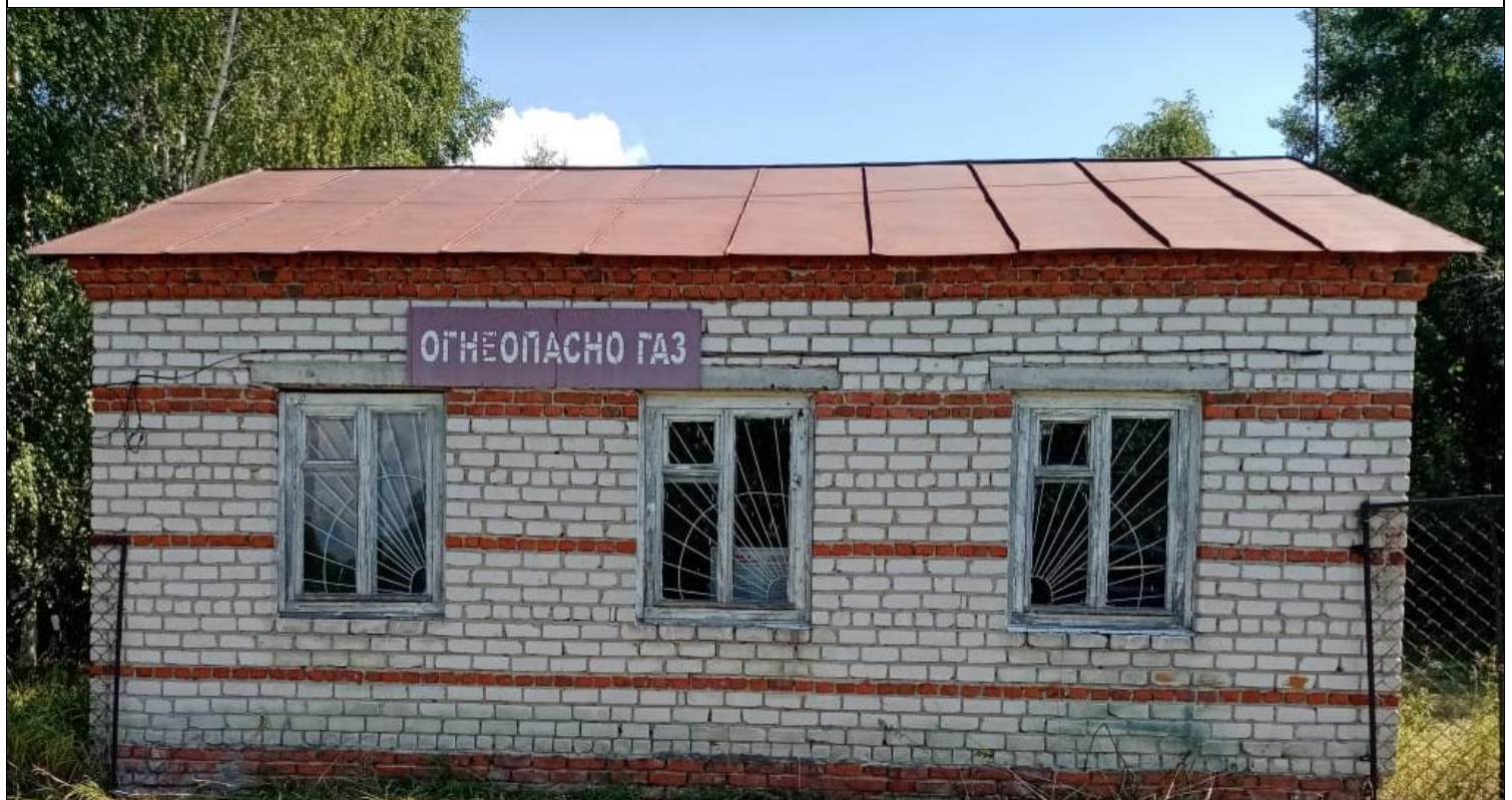
Нежилое строение – Склад хранения баллонов