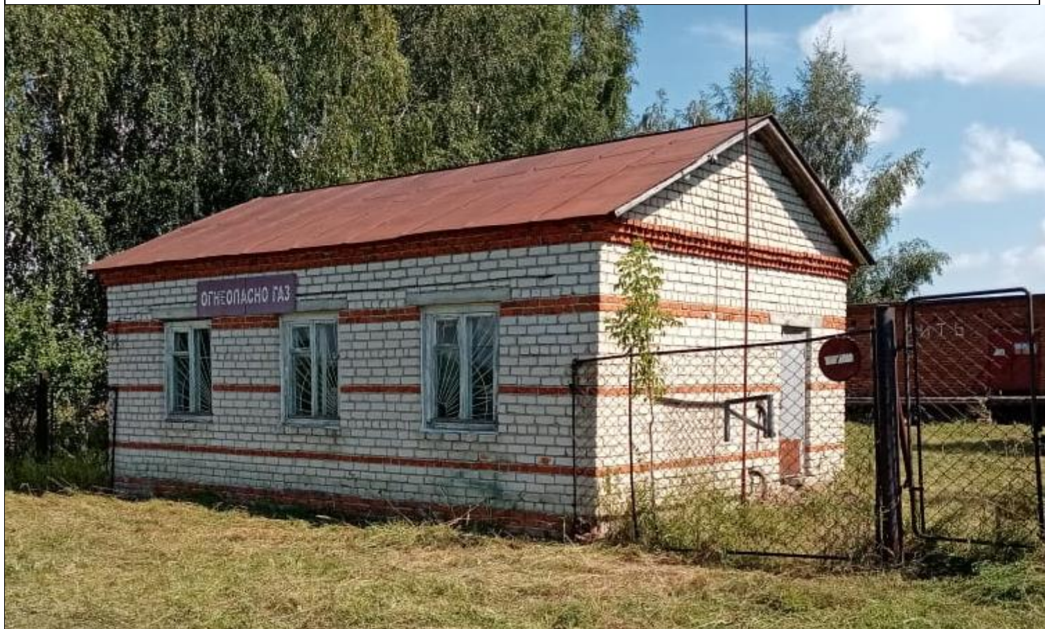
Нежилое строение – Склад хранения газовых приборов